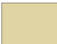
Beige ± RAL 1001