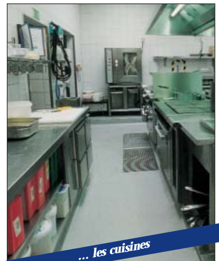
... les cuisines