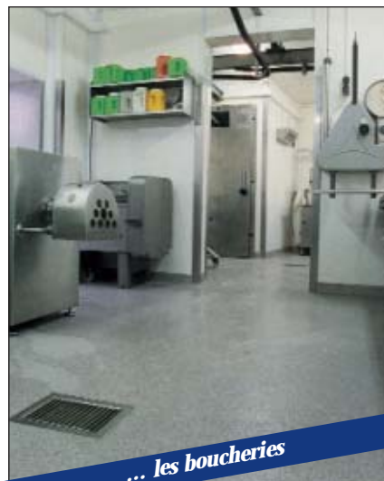
... les boucheries