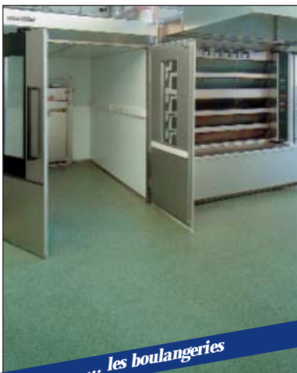
... les boulangeries

Les applicateurs agréés de RPM/Belgium N.V. et Alteco Technik GmbH sont à votre disposition pour intervenir quand vous le désirez.